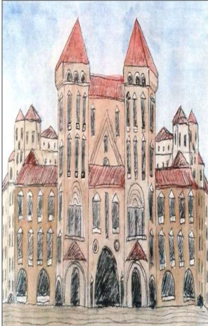
UTU UNIVERSIDAD TSEYOR DE UOMMO